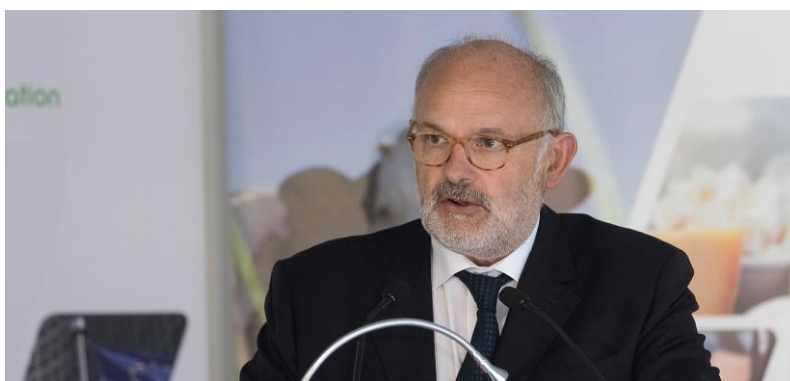
Przewodniczący EDA Michel Nalet

„ Wzmacnianie elementów środowiskowych, opcje dla podejść bardziej nakierowanych na poziomie krajowym, generacyjne odnowienie oraz ustanowienie platformy zarządzania ryzykiem są najbardziej potrzebnymi elementami przyszłej CAP. W odniesieniu do Wspólnej Organizacji Rynku , https://eur-lex.europa.eu/legal-content/EN/TXT/PDF/?uri=CELEX:32013R1308&from=EN , bazowe cechy siatki bezpieczeństwa nie są zmienione. Limity budżetowe dot. Schematu Mleka w Szkole będą na pewno tematem dyskusji w ramach dalszego procesu.